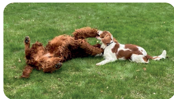
Sir Fender med buskompisen Juni